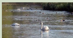
Oostbroek en Niënhof

Het vierde en vijfde Aardkundig Monument heeft een introductiefilmpje gekregen, Oostbroek/Niënhof en Lange en Korte Duinen. Ook het Leersumseveld is in beeld gebracht. Filmpje kijken? Klik op het plaatje.