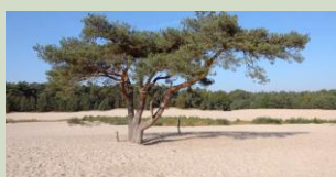
Lange en Korte Duinen