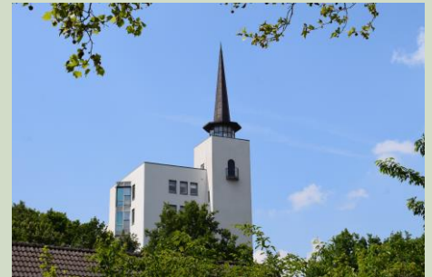
De Koerheuvel in Rhenen

Tijd: dinsdag 22 oktober 2019, 14.00-16.00 uur. Deelname is gratis. Je kunt je aanmelden via email: geoparkexcursie@gmail.com o.v.v. 'Rhenen 22/10, aantal personen, naam en telefoonnummer'. Je krijgt dan een mailing over het verzamelpunt.