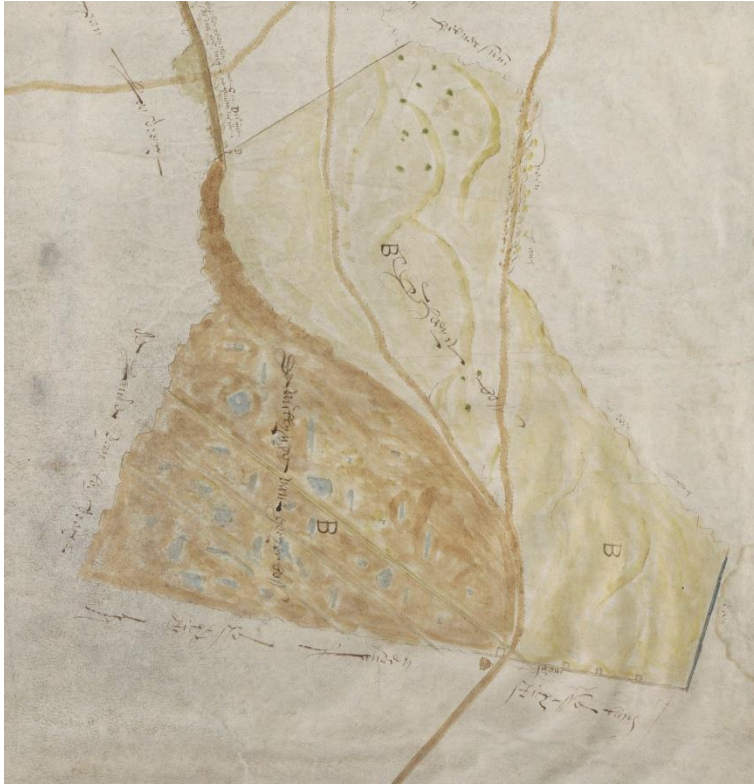
Het Gooiersbos, uitsnede van een kaart van het Gooi in 1597, door Floris Jacobsz. Op de kaart staan de eigendommen van de bosmarke, maar het bos is al verdwenen, behoudens enkele kleine restanten aangegeven met groene puntjes, in de buurt van de Hoorneboeg.